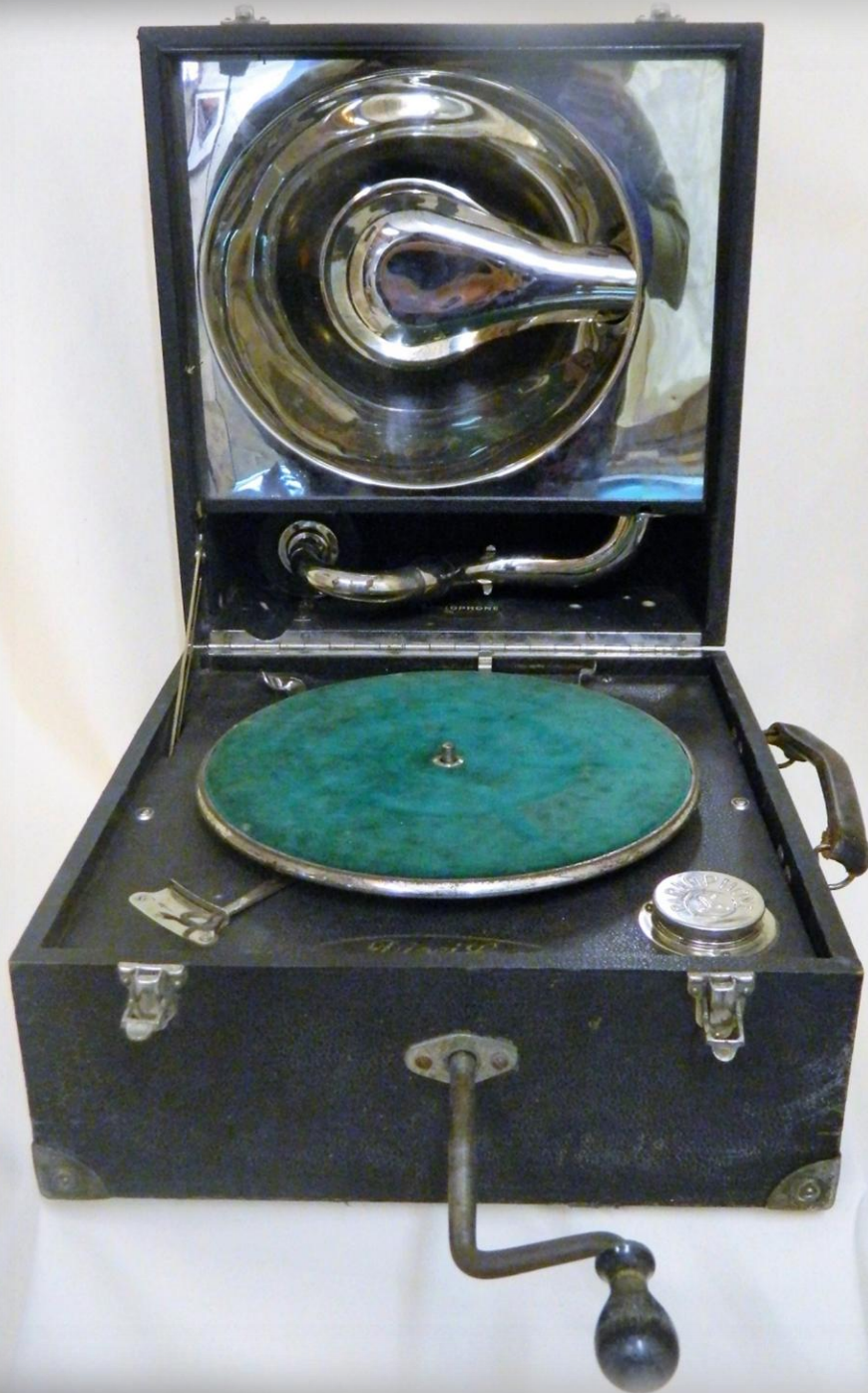
GRAMOFON PARLOPHONE DISC C Godina izrade: 20-te godine 20. stoljeća, Njemačka Vlasnik: Muzej Grada Šibenika